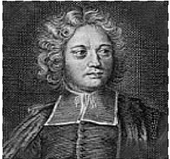
Abbé Castel de Saint-Pierre

Eine „unversiegbare Quelle von Wohlstand und Überfluß, der Ruhe und des Glücks“ wäre der Ersatz für die Unsicherheit des Kriegsglücks, dessen Wechselhaftigkeit der Abbé den Adressaten