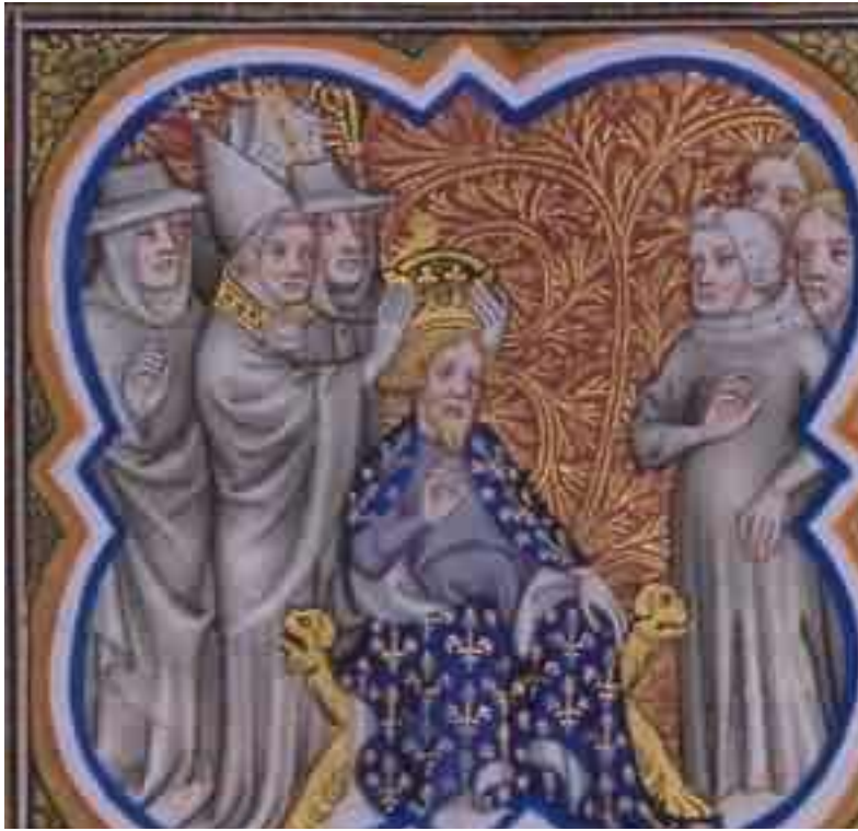
Kaiserkrönung Karl's in Rom im Jahre 800

Suprematistreit zwischen Kaiser und Papst, deren jeweilige Universalitätsansprüche nicht zum Durchbruch kamen und in der Folgezeit degenerierten.