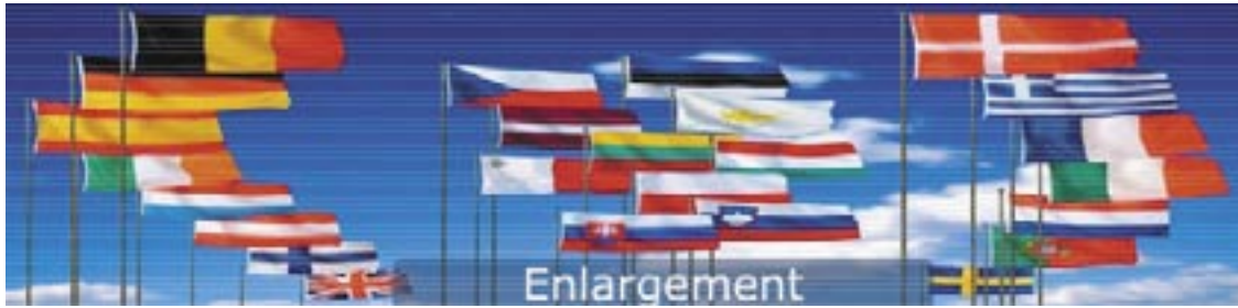
Flaggen der jetzt 25 Mitglieder Europas

auch der Guttheißung des Senats unterbreitet wird“.