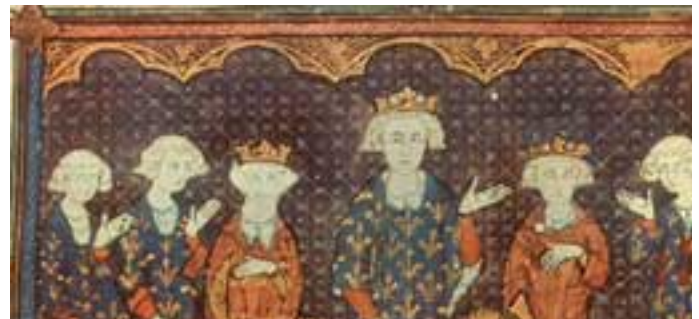
Philipp der Schöne (Philipp IV) inmitten seiner Kinder. Der frz. König für den Pierre Dubois seine Ideen, die unter der Konziliarsidee subsummiert worden, entwickelte

Der erste dieser Pläne stammt von dem französischen Juristen Pierre Dubois (1250-1321) mit seinem Traktat „Über die Wiedergewinnung des Heiligen Landes“ mit dem er seinen Zeitgenossen ein enormes Paket von Vorschlägen zur Reform der Christenheit vorlegte. So 13) ollte das gesamte öffentliche Leben - Rechtswesen, Militär, das Erziehungswesen, die Kirche, die Staatsverwaltung“ - umgestaltet werden und die Christenheit sollte sich „gleichsam