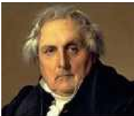
Comte de Saint-Simon

vorwirft, womit er meint, die Regenten hätten keine andere Interessen als ihre eigenen. Um den Frieden zu sichern, schreibt er, ist es unumgänglich, „daß sich alle europäischen Völker durch eine politische Institution binden“ und zwar deshalb, weil für alle Vereinigungen der Völker, wie die der Menschen Gemeinschaftseinrichtungen nötig sind, andernfalls sich alles nur durch die Macht lösen läßt. „Mehr als irgendein früherer Plan fußt der von Saint-Simon auf die Wirtschaft und darf als wahre Vorläufer der institutionellen Richtung des Föderalismus unseres 20. Jahrhunderts gelten“ meint Denis de Rougemont und bezieht sich dabei auf die Akzente der wirtschaftlichen Interessen, die Saint-Simon z. B. durch die direkte Wahl der europäischen Abgeordneten durch die Berufsverbände einführen will.