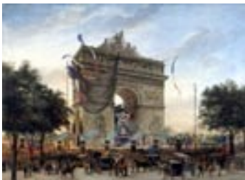
Victor Hugo Begräbnisfeierlichkeiten 1840

„Das 20. Jahrhundert wird der Schauplatz sein für eine außergewöhnliche Nation. Diese Nation wird groß sein, doch die Größe wird ihrer Freiheit keinen Abbruch tun. Sie wird berühmt sein, äußerer Wohlstand und geistiger Reichtum, Friedensliebe und ein herzliches Verhältnis zur übrigen