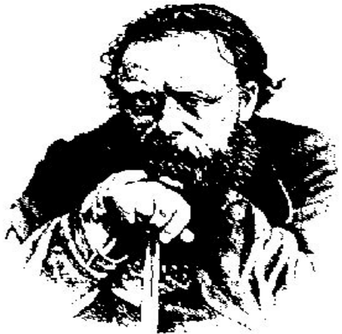
Joseph Proudhon 1809-1865

1872, nach dem Krieg von 1870 und 1882 nimmt Victor Hugo nochmals das Thema in begeisternden Reden auf. Eine wissenschaftlich-grundlegende