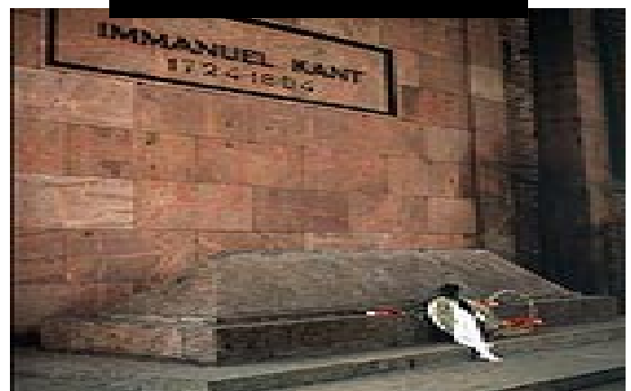
KANTS GRABSTÄTTE IN KÖNIGSBERG

Zustand herausgehen zu sollen“ (weil sie, als Staaten, innerlich schon eine rechtliche Verfassung haben, und also dem Zwang anderer, sie nach ihren Rechtsbegriffen unter eine erweiterte, gesetzliche Verfassung zu bringen, entwachsen sind), indessen daß doch die Vernunft vom Throne der höchsten moralisch gesetzgebenden Gewalt herab, den Krieg als Rechtsgang schlechterdings verdammt, den Friedenszustand dagegen zur unmittelbaren Pflicht macht, welcher doch, ohne einen Vertrag der Völker unter sich, nicht gestiftet oder gesichert werden kann; so muß es einen Bund von besonderer Art geben, den man den Friedensbund (foedus pacificum) nennen kann, der vom Friedensvertrag (foedus pacis) darin unterschieden sein würde, daß dieser bloß e i n e n Krieg, jener aber a l l e Kriege auf immer zu endigen suchte“).