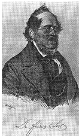
FRIEDRICH LIST 1789-1846