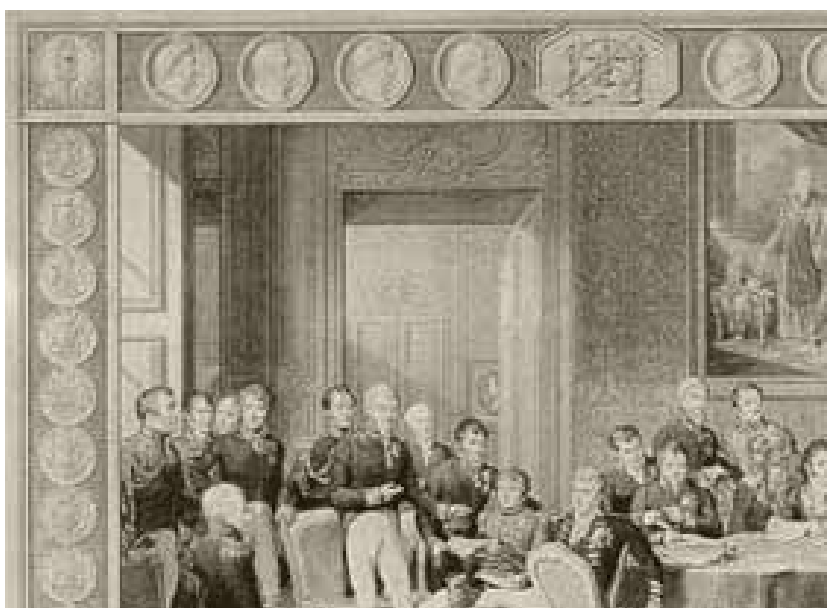
WIENER KONGRESS 1814/15 Der Pariser Hofkünstler Jean Baptiste Isabey war im Gefolge der französischen Delegation nach Wien gereist und hatte dort Porträtzzeichnungen der Kongreßteilnehmer angefertigt. Die ordnungsgeschmückten Sitzungsteilnehmer sind um einen runden Verhandlungstisch oder vor dem Fenster und der offenstehenden Tür zum Nebenraum gruppiert. Mit einer eleganten Geste weist der österreichische Staatskanzler Metternich auf den britischen Außenminister Castlereagh, der leger seinen linken Arm über die Stuhllehne fallen läßt. In aufrechter Haltung ihm gegenüber sitzt der preußische Staatskanzler Hardenberg, hinter dem der englische Herzog von Wellington Blickkontakt zu seinem Landsmann sucht. Hinter dem französischen Vertreter Talleyrand, der in selbstbewußter Haltung seinen rechten Arm auf den Verhandlungstisch geliegt hat und durchaus gleichberechtigt neben den Delegierten der Siegermächte wirkt, steht als zweiter von rechts Wilhelm von Humboldt. Rasoumoffsky, der Vertreter Zar Alexanders I., ist etwa in der Bildmitte, vor der linken unteren Ecke des Gemäldes, zu erkennen.

und drittens ein Staatenbund, der entweder durch ein Schiedsgericht oder durch konstitutionelle Bande zusammengehalten werden sollte. Die beiden ersten Pläne lehnt er ab, so bleibt ihm nur die föderative Lösung, wobei er, nach Darlegung der guten Gründe für eine solche Lösung der Europaprobleme - in einer Kritik des „Extrait“ von Rousseau - pessimistisch äußert: „Die Schwierigkeit oder vielmehr die gänzliche Unmöglichkeit der Sache liegt keineswegs in der Entstehung des Bundes: sie liegt in den Bedingungen seiner Dauer. Ein freier Vertrag unter Staaten wird immer nur so lange beobachtet werden, als keiner von denen, welche ihn schlossen, zugleich den Willen und die Macht, ihn zu brechen, besitzt, d. h. mit anderen Worten, solange auch ohne einen solchen Vertrag der Friede, welchen er gründen soll, bestehen würde“. Daher kommt er zwangsläufig zurück zum Ideal des wenn auch unbefriedigenden, aber funktionierenden Systems des Gleichgewichts, da eine „neue Völkerverfassung“ wenn sie denn jemals kommen sollte, eher ein Glücksfall wäre, denn eine zu erwartende Möglichkeit in naher Zukunft.