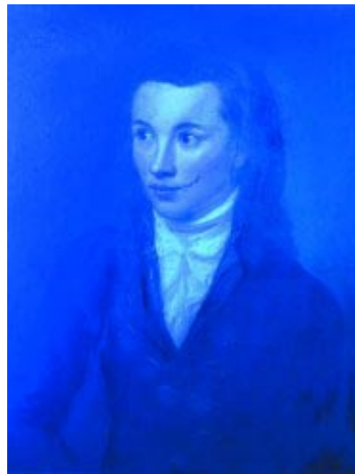
Novalis (Freiherr von Hardenberg)

„Für Novalis „waren es schöne, glänzende Zeiten, wo Europa ein christliches Land war, wo e i n e Christenheit diesen menschlich gestalteten Weltteil bewohnte, ein großes gemeinschaftliches Interesse verband die entlegensten Provinzen dieses weiten geistlichen Reichs 38) . Er bestreitet den Staaten, die in „Mangelhaftigkeit und Bedürftigkeit“ ihrer Einrichtungen die „furchtbaren Phänomene“ offenbaren und sieht das Heil in einem