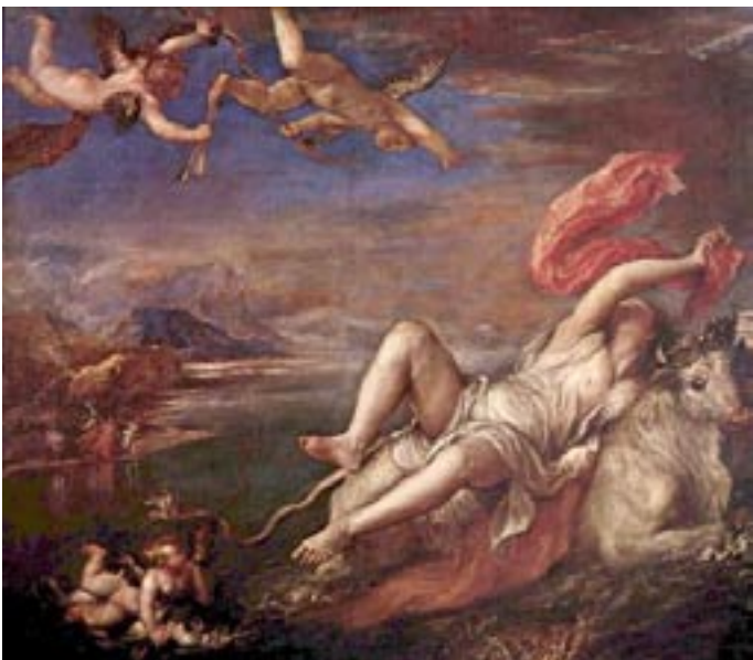
Titian - Zeus in Stier-Gestalt entführt Europa

Mit der geographischen Abgrenzung des Kontinents (3) , den Ausdeutungsversuchen seiner kulturellen und ethnographischen Eigenart, die mit Klima-Unterschieden (4) , verschiedener Geomorphologie (5) , Rassenunterschiede begründet wurden, formte sich allmählich die für Europa signifikante Eigentümlichkeit, wobei der Topos „Europa,“ zwar kontinuierlich, zeitweilig mehr oder weniger gebräuchlich, oft synonym für den Begriff Occidens steht. Vom Terminus „imperium,“ erdrückt, findet er allenfalls, infolge der weiten Unbekanntheit des Erdteils als Provinzname, zwar während der imperialen Epoche Roms Erwähnung, seine Fortführung als Synonym des Begriffs Occidens im Gegensatz zu Oriens fanden Exegeten aber hauptsächlich in der frühchristlichen Literatur.